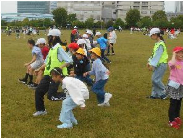
こどもたちに大人気のだるまさんが転んだ。 「はじめのいっ～ぽ、だるまさんが眠った!？」