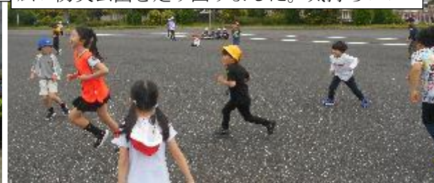
広い防災公園を走り回りました。気持ちいい～