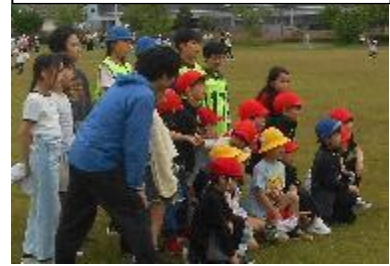
集合写真も撮りました