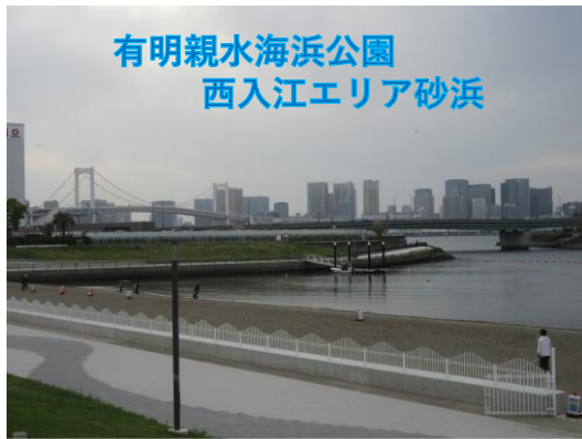
有明親水海浜公園 西入江エリア砂浜

臨時の朝会を行い、新しくできた有明親水海浜公園西入江エリア砂浜の話をしました。とてもきれいな砂浜ですが、マリンスポーツのために作られており、海底が突然深くなっているそうです。そのために、こどもたちと「自分や友達の命を守る3つの約束」をしました。ご家庭でもご指導をお願いいたします。