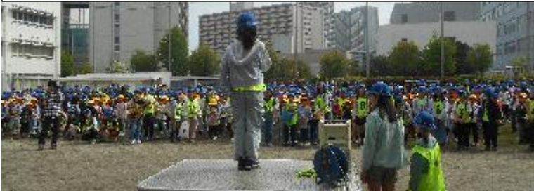
全校遠足の出発式。児童会が司会、代表の言葉を務めました