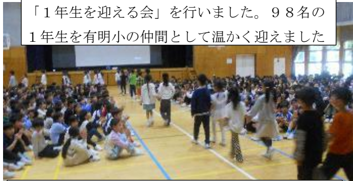
「1年生を迎える会」を行いました。98名の1年生を有明小の仲間として温かく迎えました