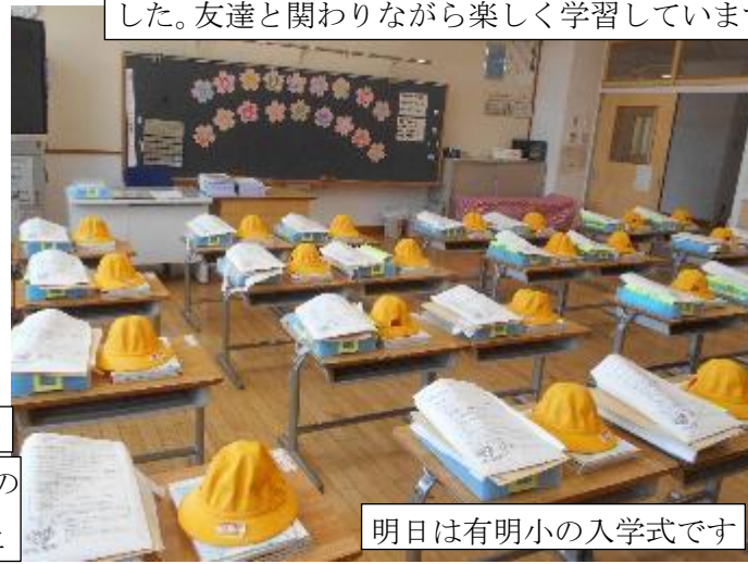
明日は有明小の入学式です