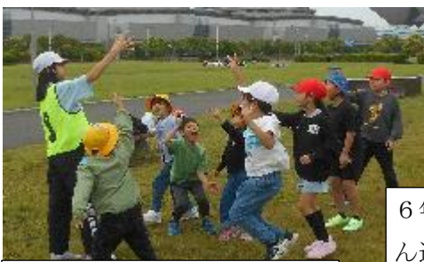
ヘリポートでドッジボール！