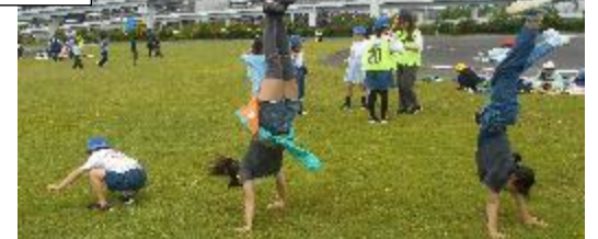
6年生「1年生がかわいかった」「下級生とたくさん遊んだ」「大変だったけどやりがいがあった」