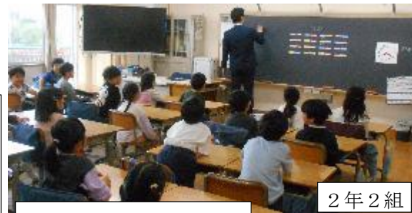
担任の先生の自己紹介

始業式では校長講話の後、担任・担当の発表が行われました。最後は校歌を元気いっぱいに歌いました。