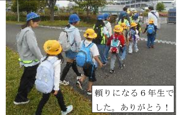
頼りになる6年生でした。ありがとう！