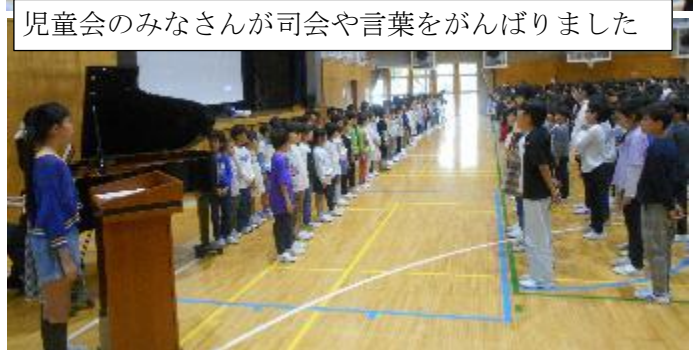
児童会のみなさんが司会や言葉をがんばりました