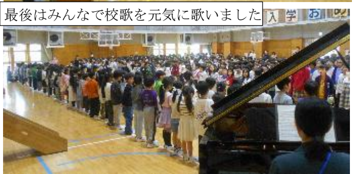
最後はみんなで校歌を元気に歌いました