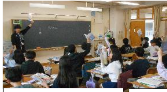
新しい教科書も配られました