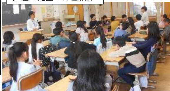
子どもたちも一人一人自己紹介