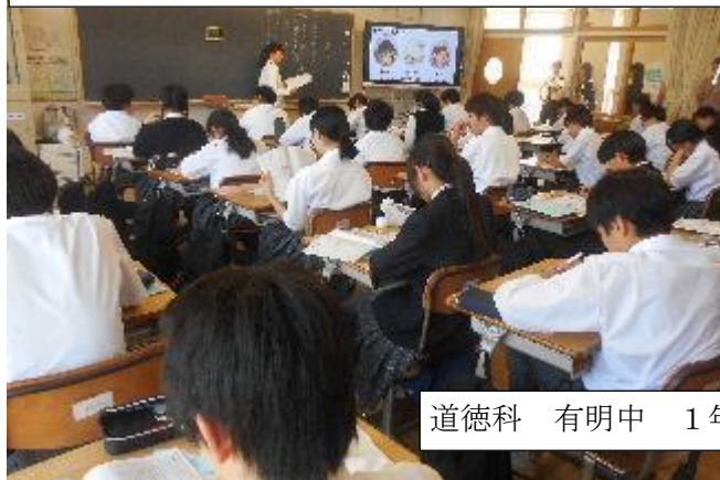
道徳科 有明中 1年