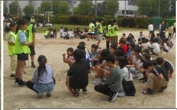
長縄の後、みんなで集まって活動を振り返ります 6年生のリーダーシップが素晴らしい！