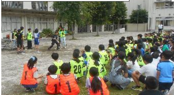
今日から長チャレ週間が始まりました