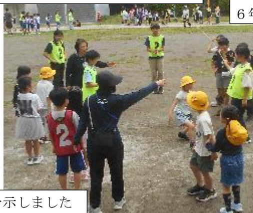
長縄は縦割り班ごとに行います