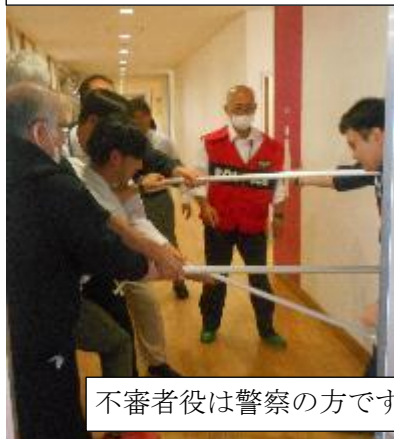
不審者役は警察の方です