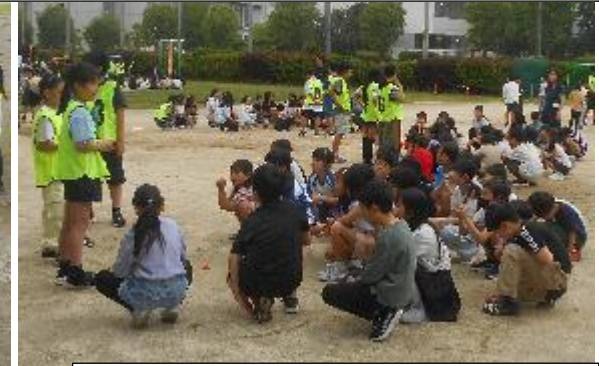
長縄の後、みんなで集まって活動を振り返ります 6年生のリーダーシップが素晴らしい！