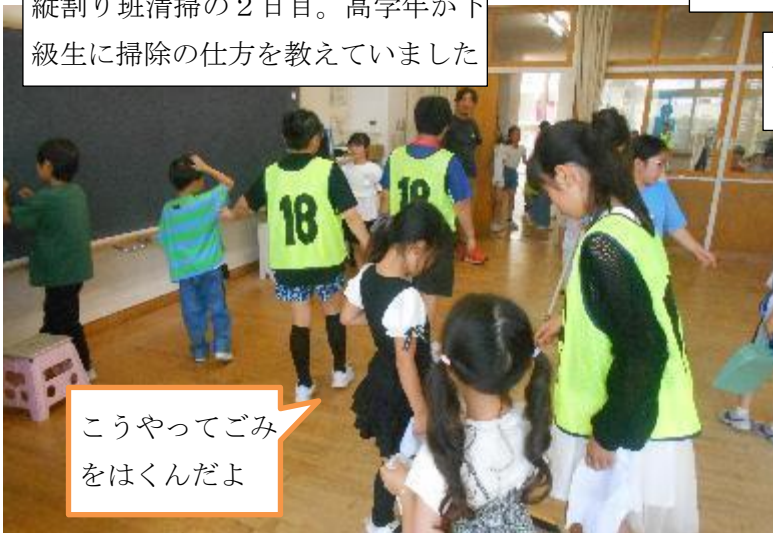
こうやってごみをはくんだよ

先々週は光化学スモッグで悔しい思いをした6年生。今日は入ることができてよかったです。午前中、5年、2年も入りました。熱中症の心配もなく快適な水泳学習でした