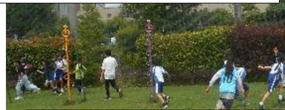
鬼ごっこ。中学生が鬼です。逃げろ～