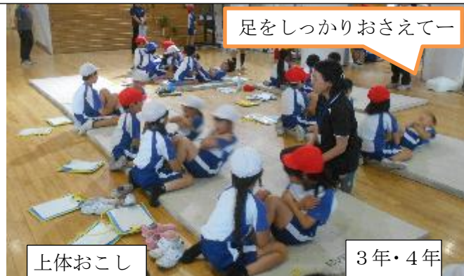
足をしっかりおさえてー