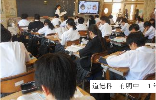
道徳科 有明中 1年

挨拶ボランティア、昨日が77名、今日は89名でした 校門前にボランティアのこどもたちがあふれていました