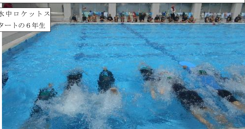
水中ロケットスタートの6年生

先々週は光化学スモッグで悔しい思いをした6年生。今日は入ることができてよかったです。午前中、5年、2年も入りました。熱中症の心配もなく快適な水泳学習でした