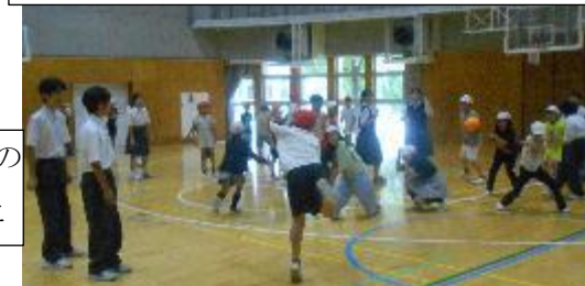
ドッジボール。小 VS 中のガチンコ勝負