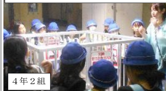
4年生社会科見学 有明水再生センター

運動委員からは、プールで気を付けることとして「かぶとむし」の話がありました。(かけない ふざけない とびこまない むりしない しっかり話を聞く) 続いて、運動委員がステージの上で、バディのやり方、プールの入り方、笛の合図による行動を実演してくれました。水泳の学習を行う上で大切なことを分かりやすく全校に伝えてくれました。