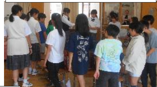
椅子取りゲームをやりながら爆弾ゲーム。2つに集中するのは難しい！