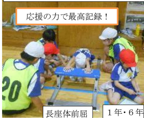
応援の力で最高記録！

今日は体力テスト一斉実施日でした。1・6年生、2・5年生、3・4年生の兄弟学年が協力し合いながら体力テストを行いました。高学年が低学年のお世話をよく頑張りました