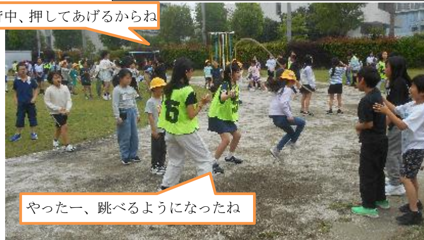
やったー、跳べるようになったね