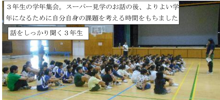
話をしっかり聞く3年生

3年生の学年集会。スーパー見学のお話の後、よりよい学年になるために自分自身の課題を考える時間を持ちました