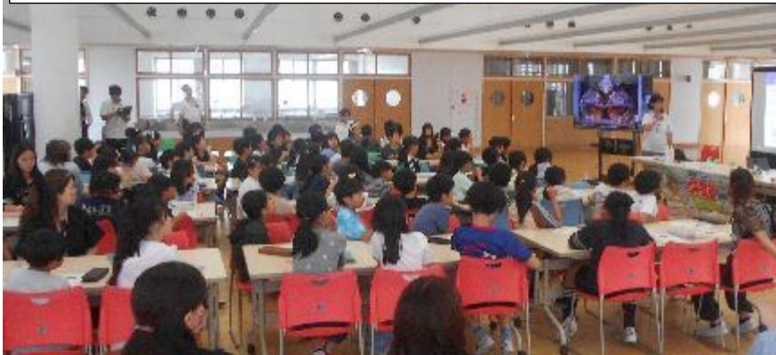
カーボンマイナスこどもアクションに向けての出前授業の様子です

本日は学校公開の最終日でした。たくさんの保護者の方にご来校いただきました。こどもたちの学習する姿、学校生活を送る姿はいかがだったでしょうか！？また、PTAの有志の方々に受け付けのお仕事をやっていただきました。ご多用の中、有難うございました。感謝申し上げます